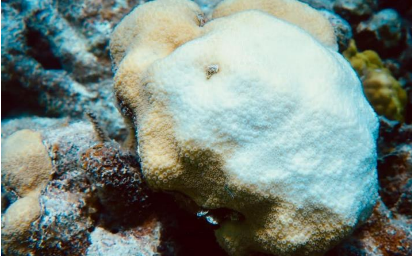
Un coral afectado.