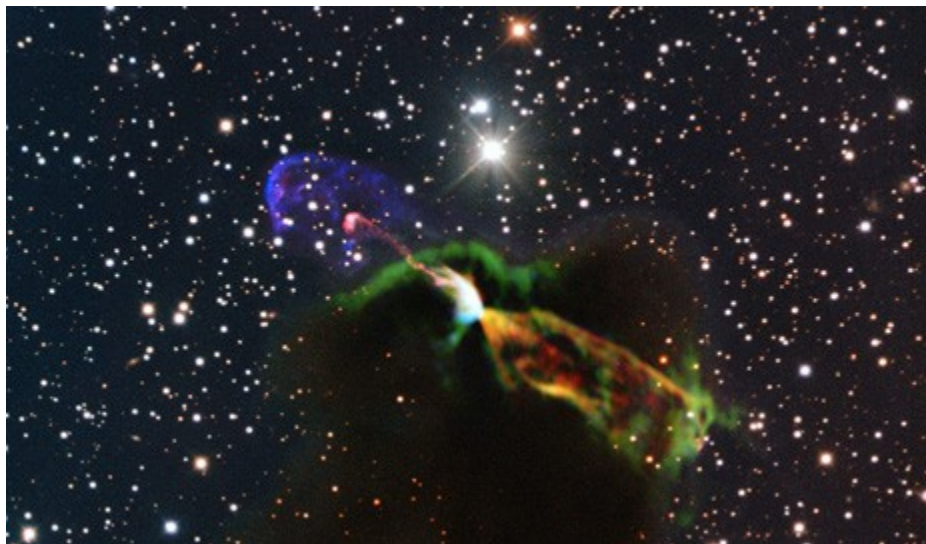
A medida que las estrellas se forman en nubes de gas y polvo, disparan potentes chorros de gas y otras materias primas hacia afuera, conocidos como salidas estelares.