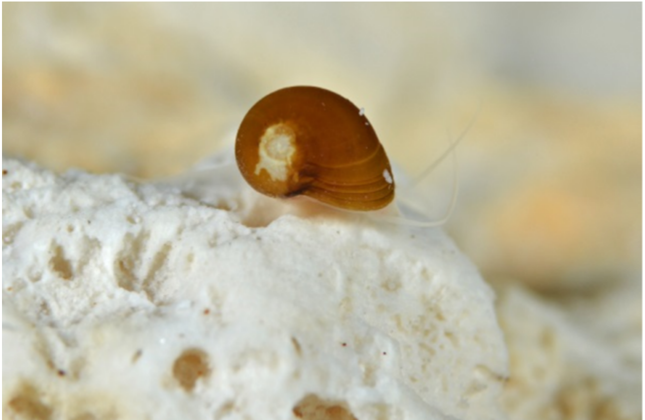
Caracol de la familia Naticidae, especie no identificada, residente de la Cueva del Agua, Isla de Mona.

¿Conoces la enigmática y peligrosa Cueva del Agua en Isla de Mona? La reciente publicación es una historia de varias exploraciones subacuáticas entre espeleotemas, nuevos descubrimientos y hasta huesos de varios animales preservados en una zona formada por calizas blandas quebradizas dentro de la Cueva del Agua.