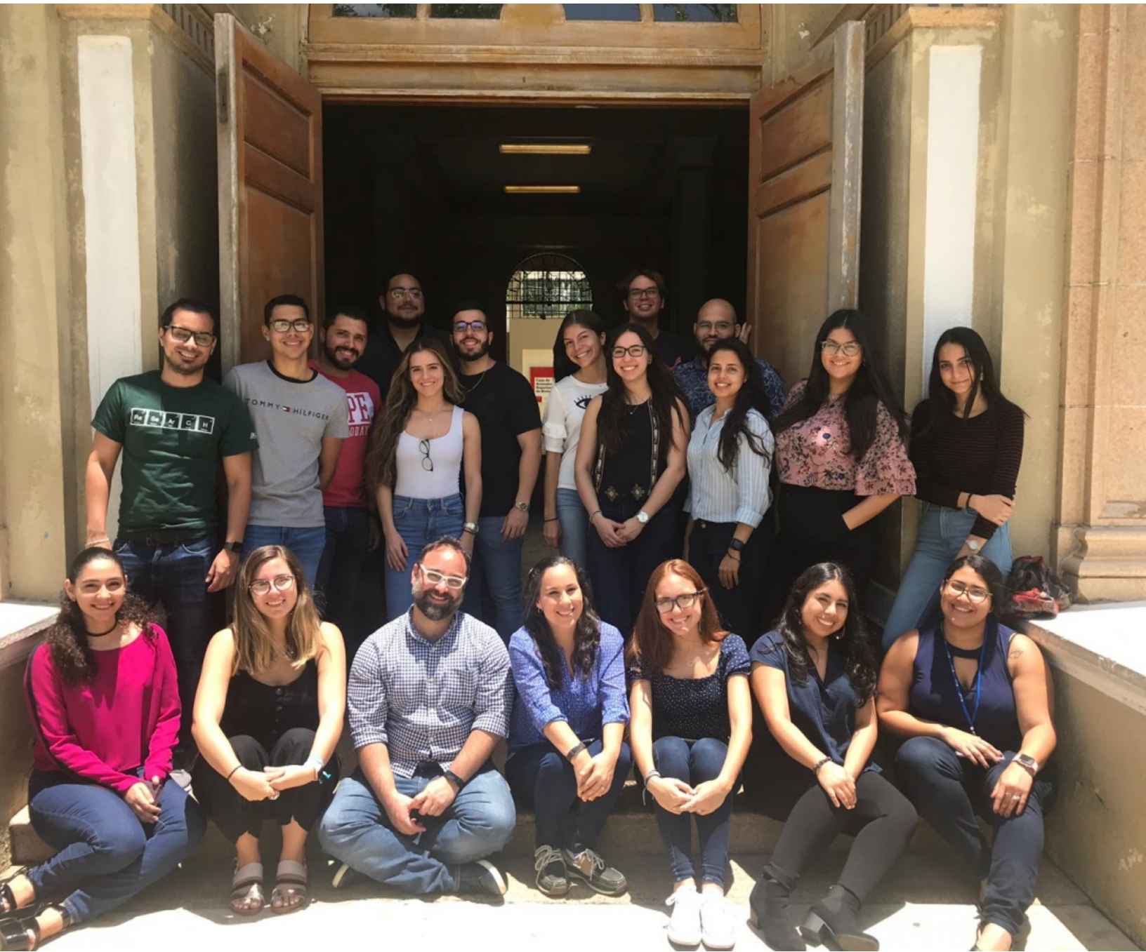
Foto grupal del JARM Lab en la UPR-RP.