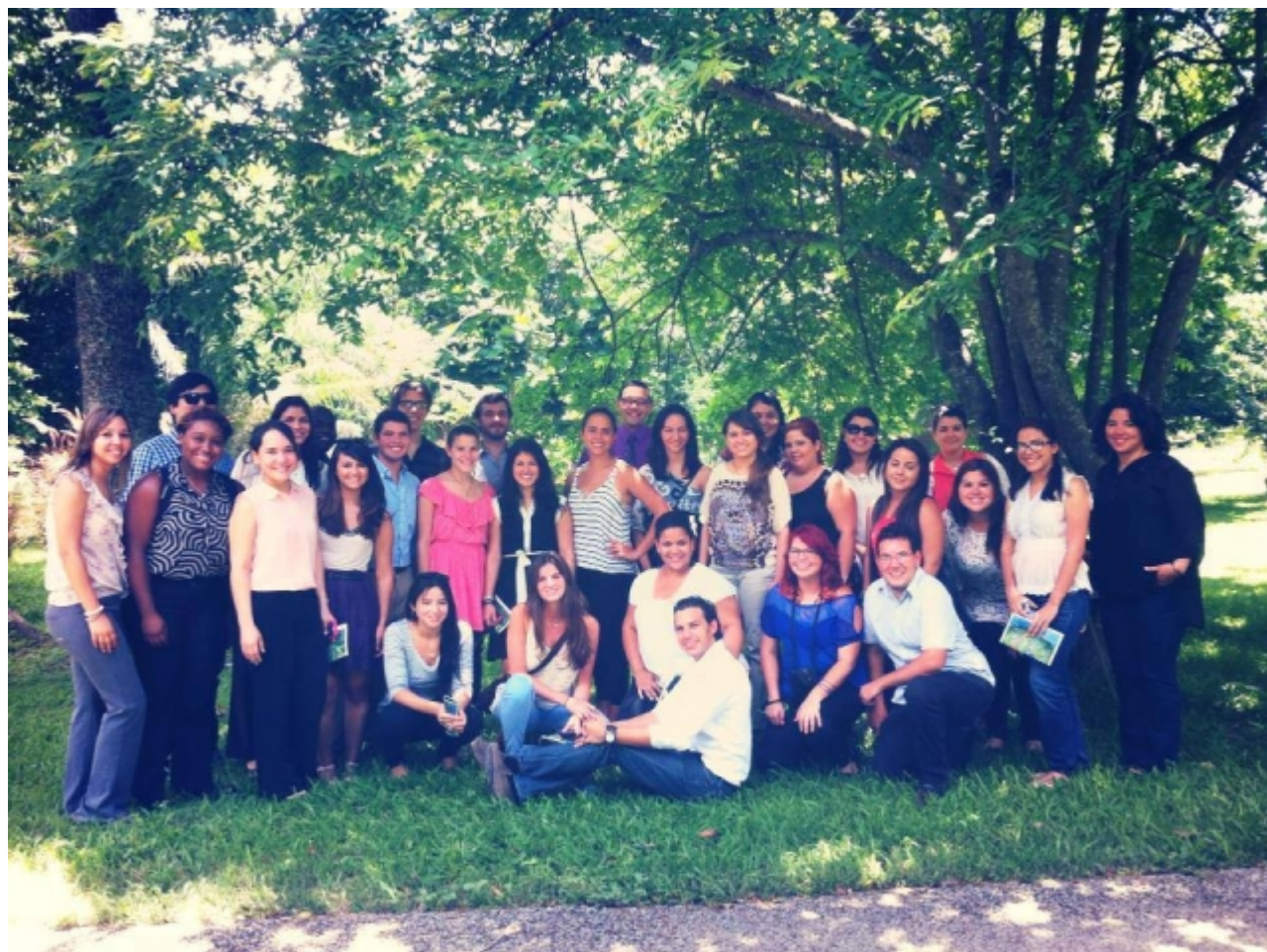
Participantes del programa PARACa 2013 de Mentes Puertorriqueñas en Acción