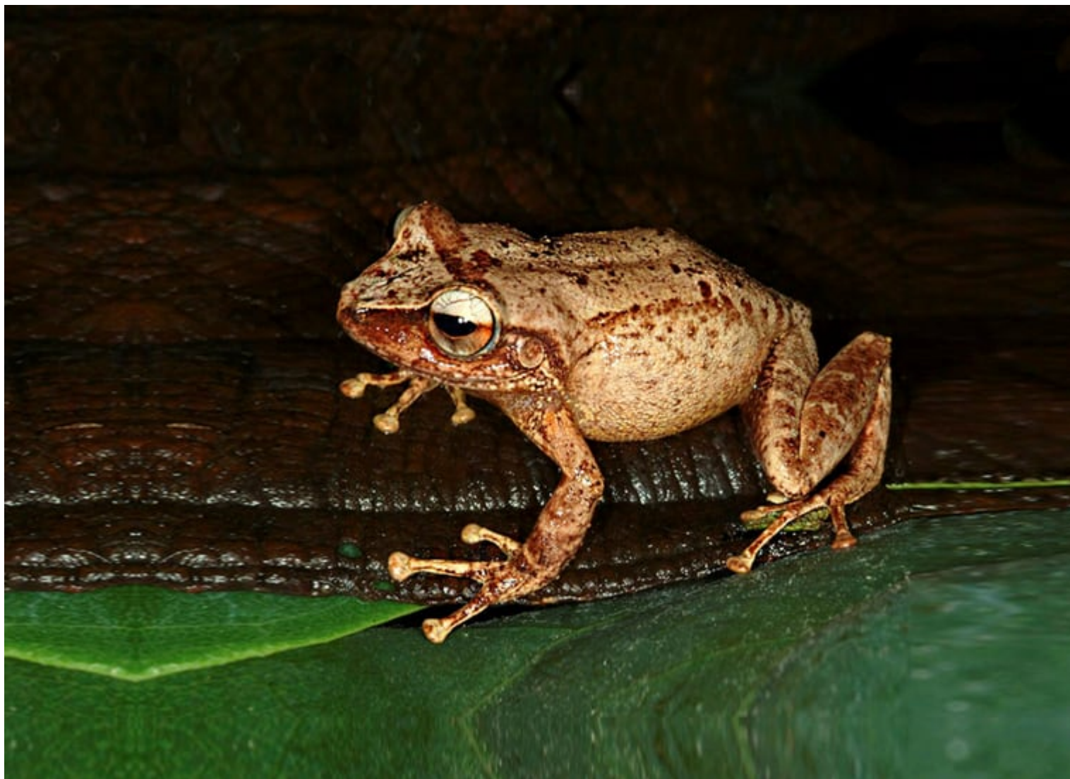
Foto del coquí de la montaña, que se puede apreciar en el bosque de Maricao y en la Sierra de Luquillo.

En esa línea, indicó que “no es coincidencia” que, durante la década de 1970, principios de la década de 1980 y comienzos y mediados de la década de 1990, hubo períodos con menos lluvia de lo normal o “años secos”, y simultáneamente se extinguieron los coquíes palmeado, dorado y de Eneida.