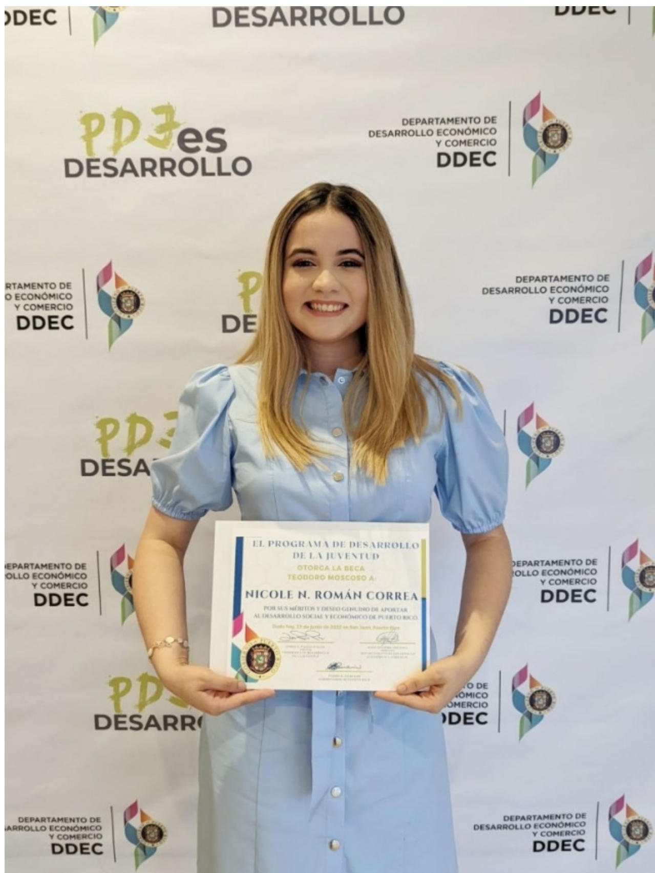
La embajadora colegial también recibió $10 mil de la beca Teodoro Moscoso, que otorga el Programa de Desarrollo de la Juventud (PDJ) del Departamento de Desarrollo Económico y