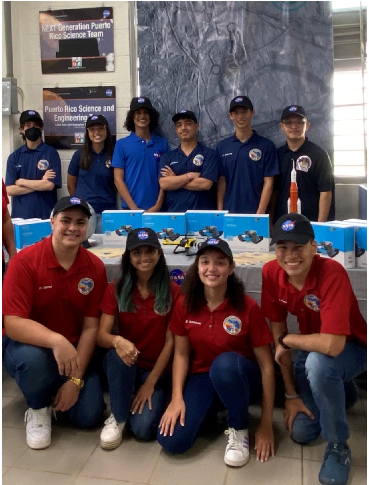
Vemos al grupo de estudiantes de CROEM que participaron del proyecto “ROAD on Icy World” de la NASA.