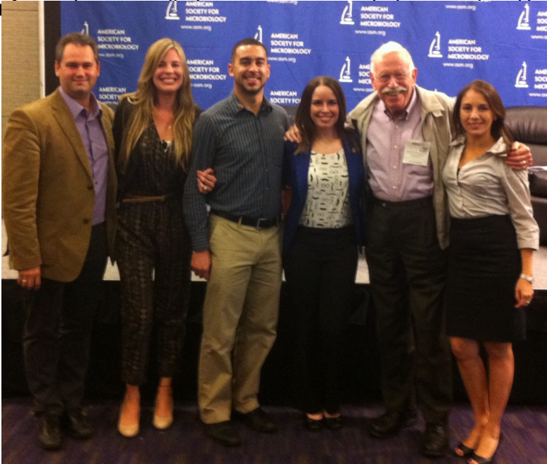
Durante ASM 2014 se inauguró [21] la