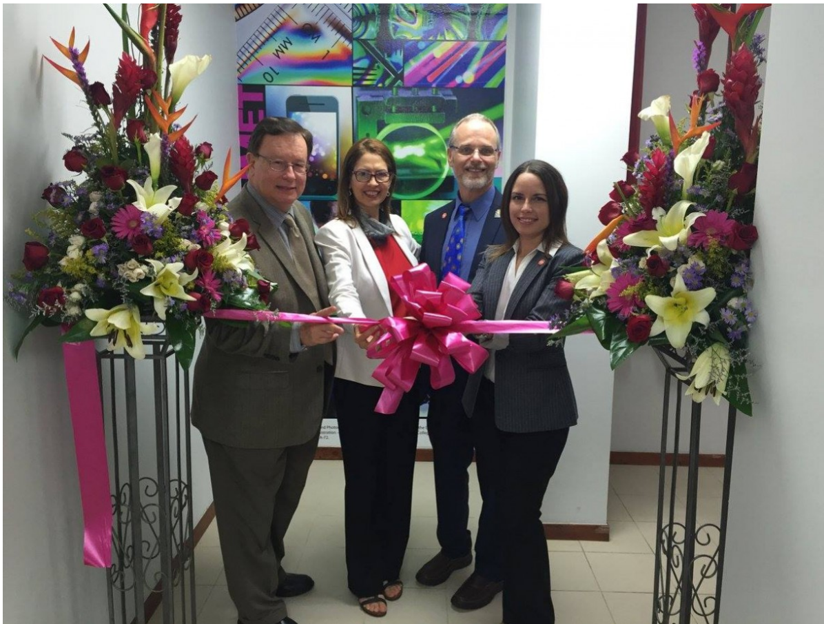
Inauguración del Instituto de Fotónica.