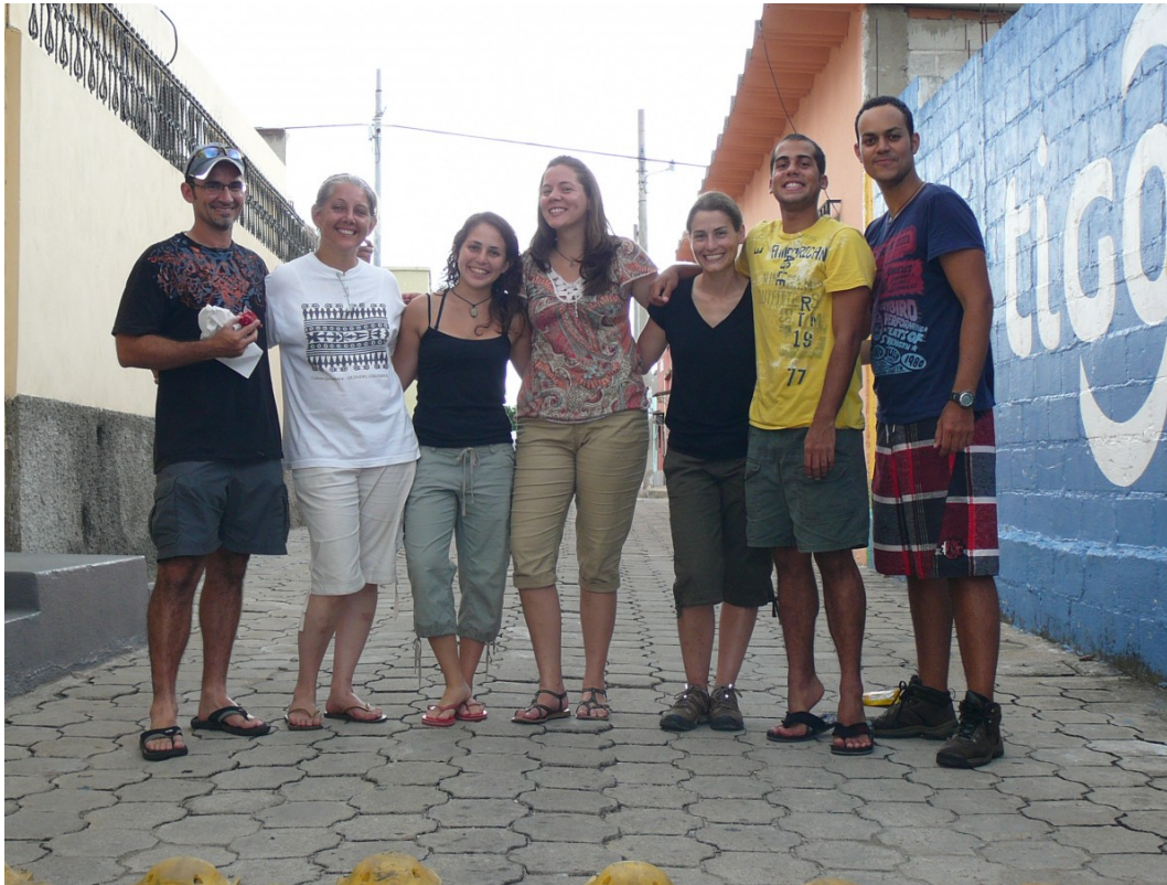
La Dra. Restrepo junto a sus estudiantes en un viaje de investigación a Guatemala.

Sin perder el tiempo, la Dra. Restrepo comenzó a buscar becas postdoctorales. Solicitó una beca Fulbright [10] , para la cual llegó semi-finalista, y ganó una beca postdoctoral de la Fundación Nacional de las Ciencias [11] . Esta beca la llevó a la Universidad de Stanford [12] y la Universidad de Nuevo México [13] , donde recuerda haber trabajado con personas extraordinarias.