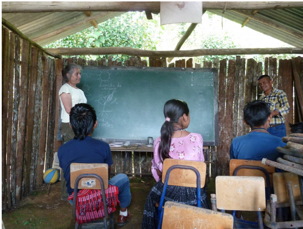
La Dra. Restrepo dando clases en comunidad Q'eqchi.

El trabajo que la Dra. Restrepo ha realizado como investigadora, educadora y mentora es un ejemplo para nuevas generaciones de científicos, especialmente para científicas borinqueñas, latinoamericanas, y en todo el mundo. Sin duda sus descubrimientos han impactado y seguirán impactando positivamente a los ecosistemas de nuestro planeta tierra.