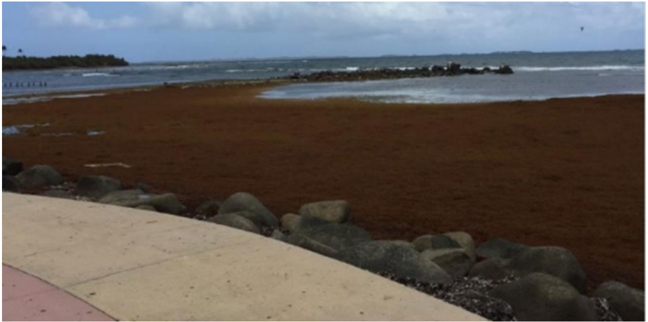
Imagen en la que se aprecia la cantidad de sargazo que se acumuló en Las Croabas, Fajardo.

La costa este y sureste de Puerto Rico ha comenzado a recibir en esta época veraniega a un visitante poco agradable, que no solo afea las playas de la zona, sino que emite un olor objetable que hace casi imposible poder disfrutar del sol y las olas. Se trata del sargazo [3], una alga parda, que flota y viaja por el mar, y que tiene un característico color marrón.