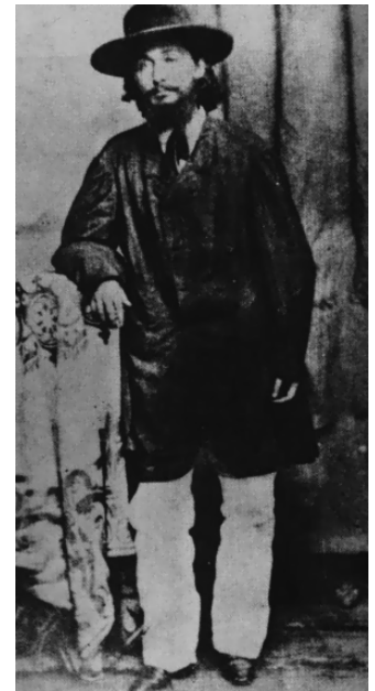
Joven médico, investigador y futuro patriota puertorriqueño Ramón Emeterio Betances

Aún así surgieron investigadores a lo largo del siglo XIX, por ejemplo, los médicos Betances , nacido en 1830, Stahl y Corchado , nacidos cerca de 1840, Del Valle y Gómez Brioso , de la década de los 50.