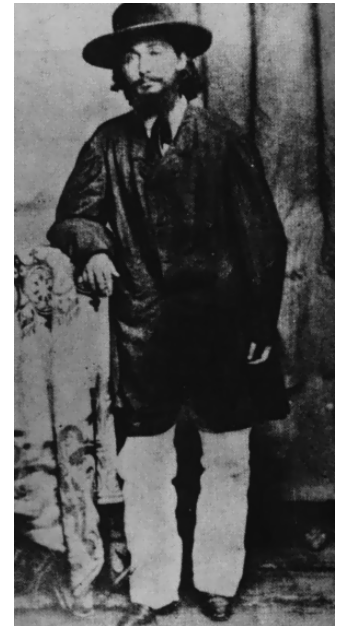
Joven médico, investigador y futuro patriota puertorriqueño Ramón Emeterio Betances

Los colosos de la investigación en salud pública a principios del siglo XX fueron Isaac González Martínez